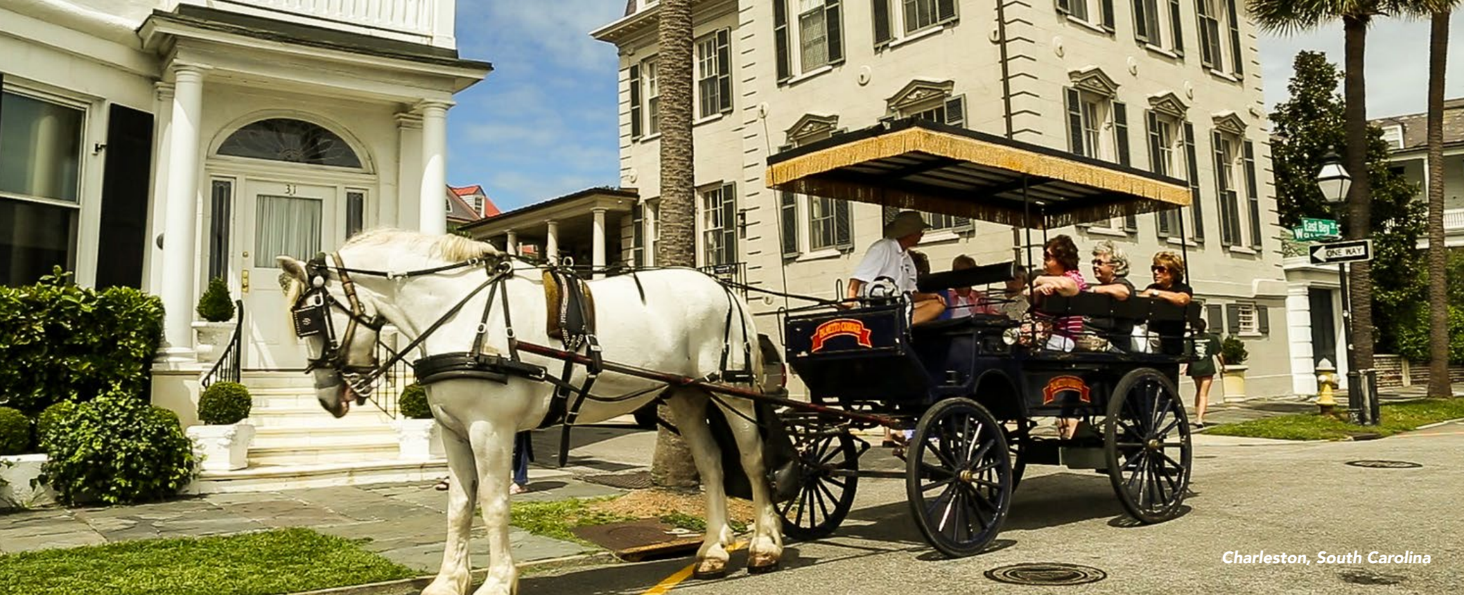
Charleston, South Carolina