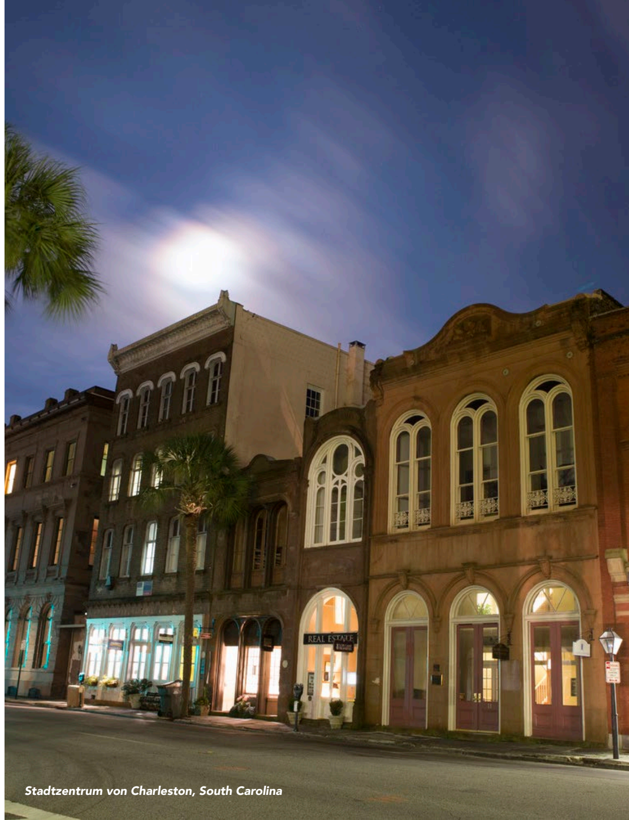
Stadtzentrum von Charleston, South Carolina