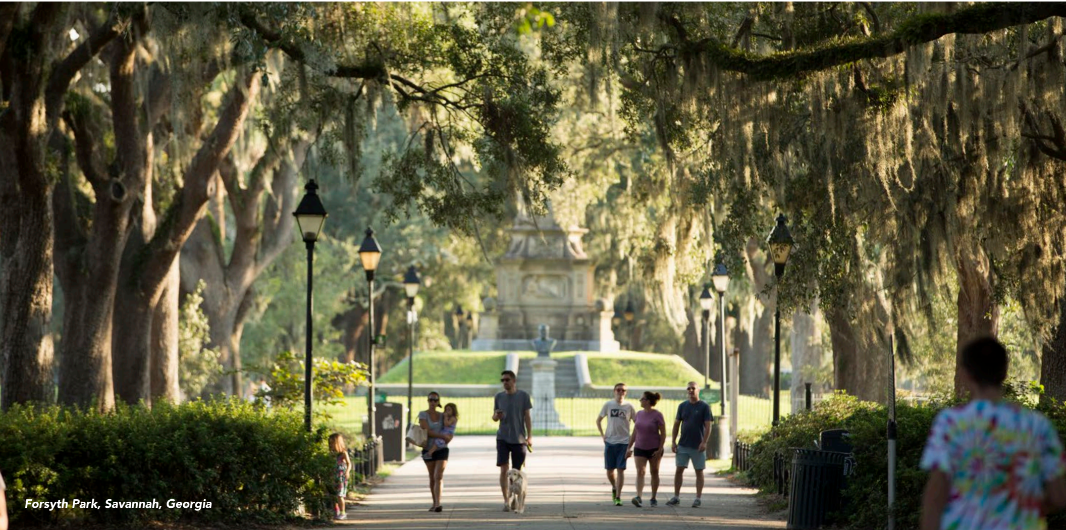
Forsyth Park, Savannah, Georgia

Weitere Urlaubsinpirationen und Reisetipps für die USA erhaltet ihr unter VisitTheUSA.com