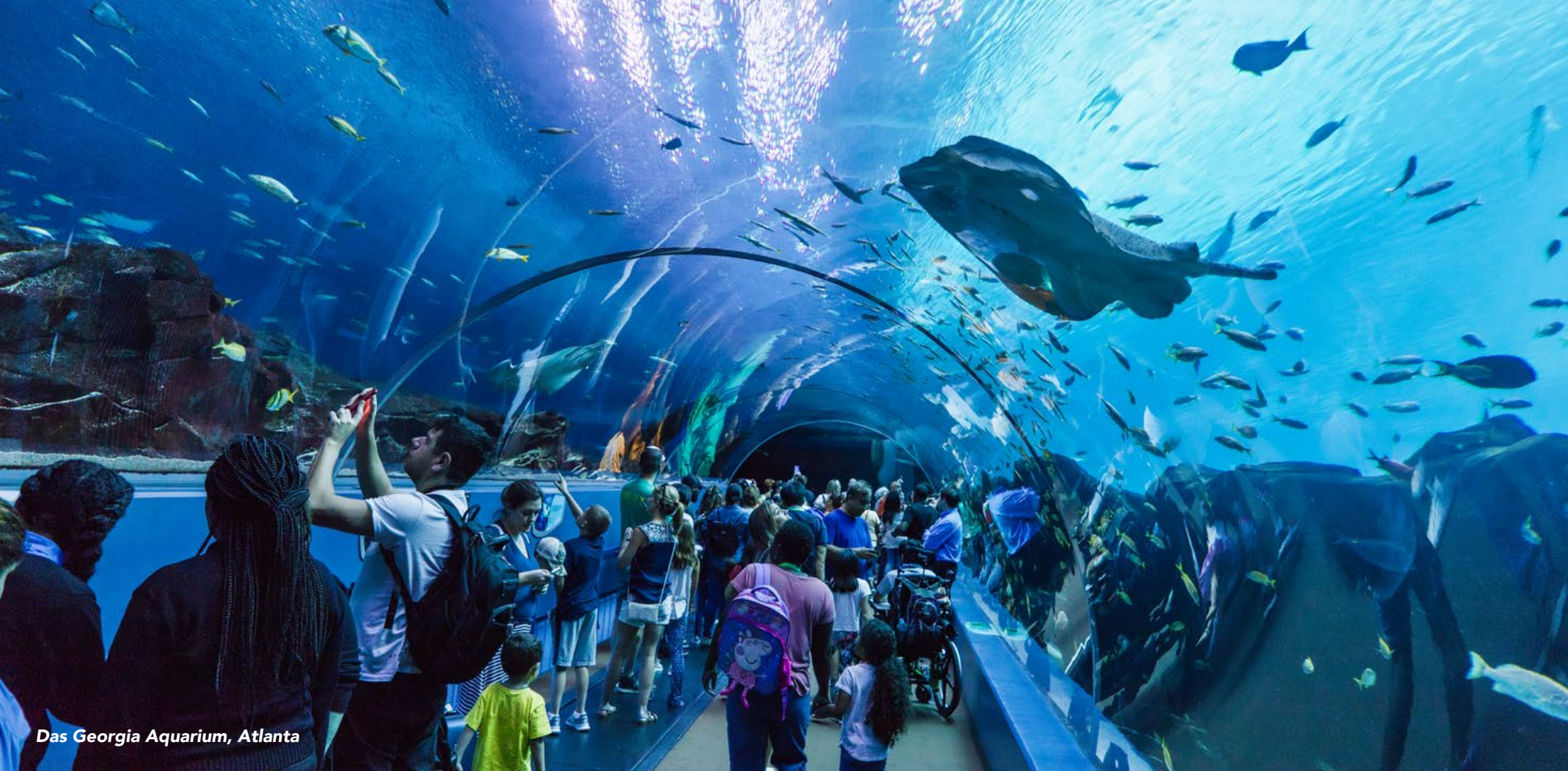
Das Georgia Aquarium, Atlanta