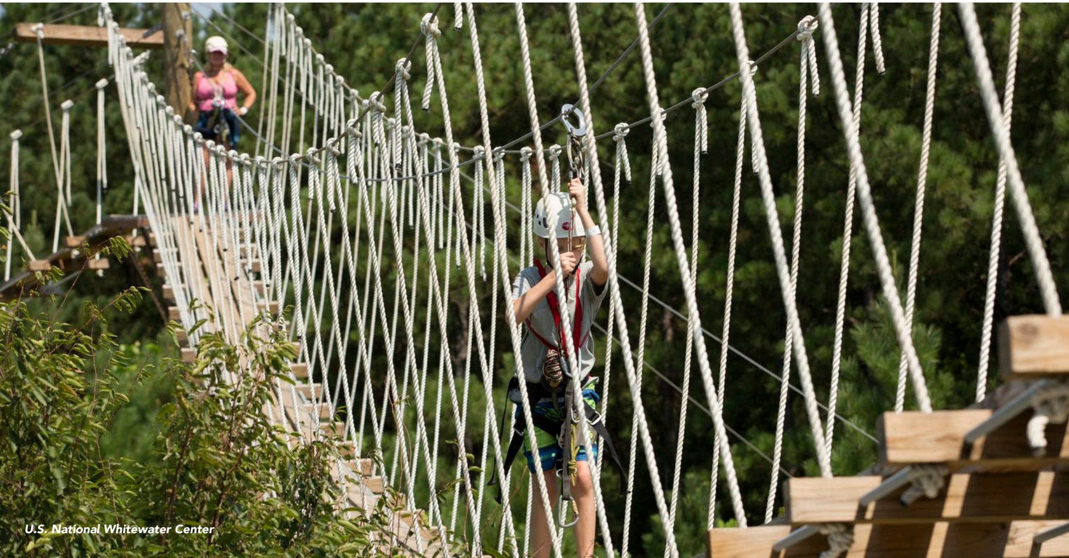
U.S. National Whitewater Center