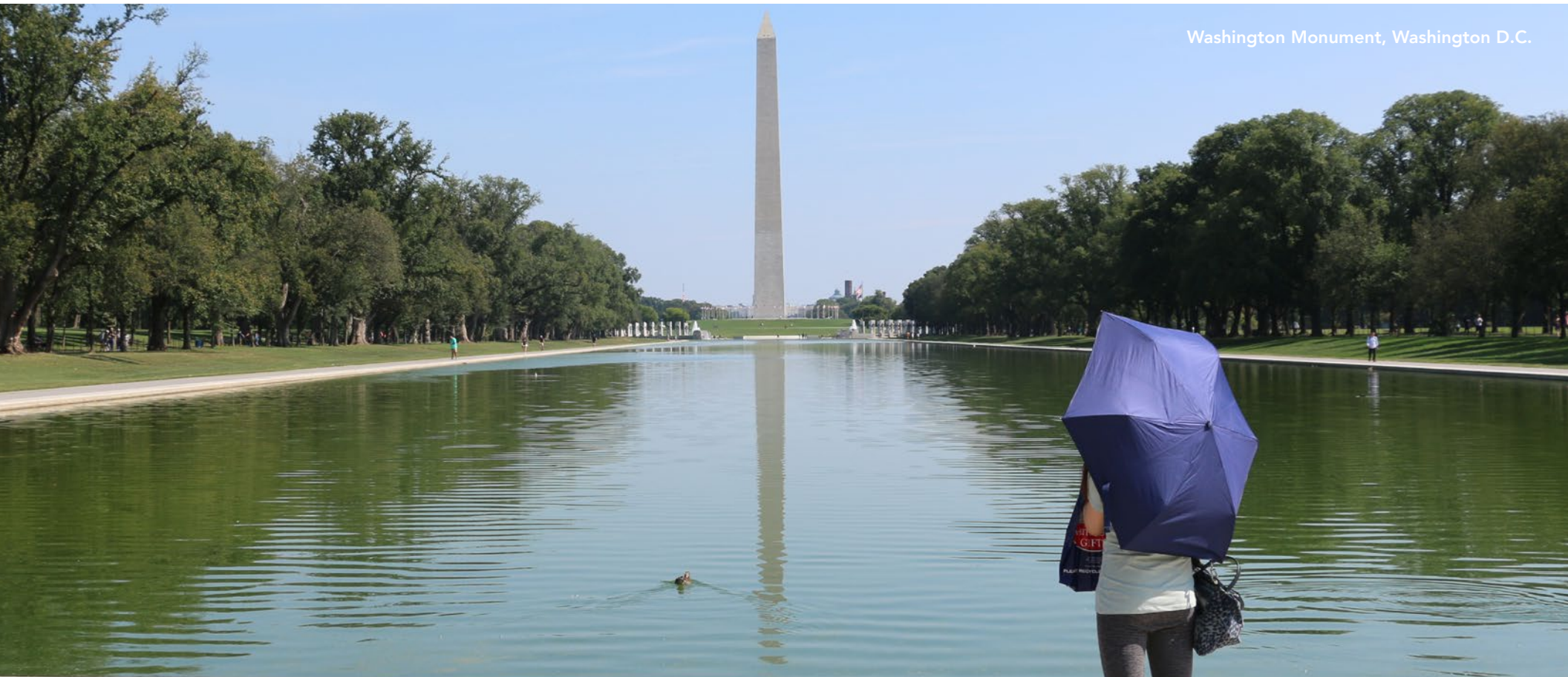
Washington Monument, Washington D.C.

Weitere Urlaubsinpirationen und Reisetipps für die USA erhaltet ihr unter VisitTheUSA.com