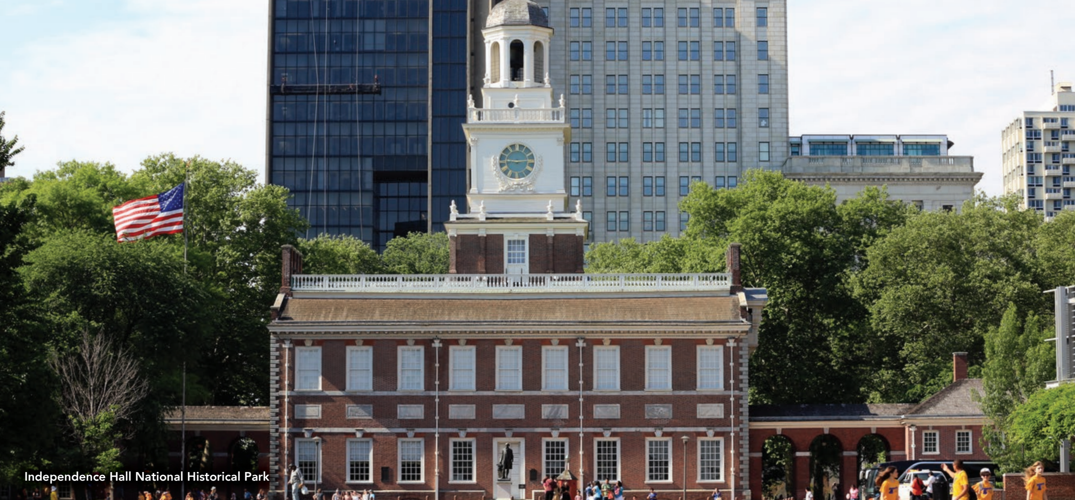
Independence Hall National Historical Park