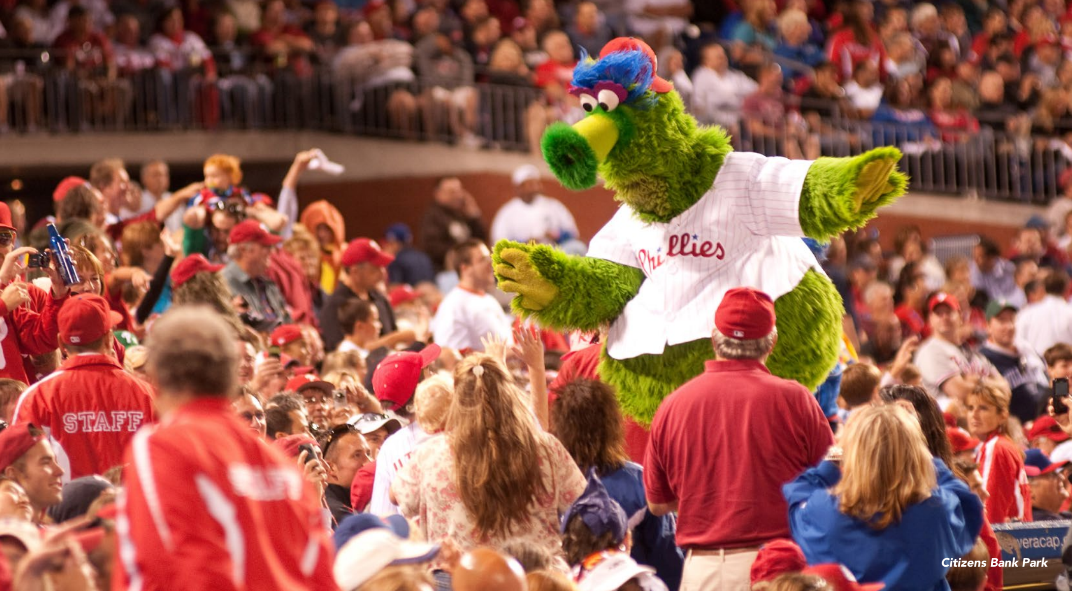
Citizens Bank Park