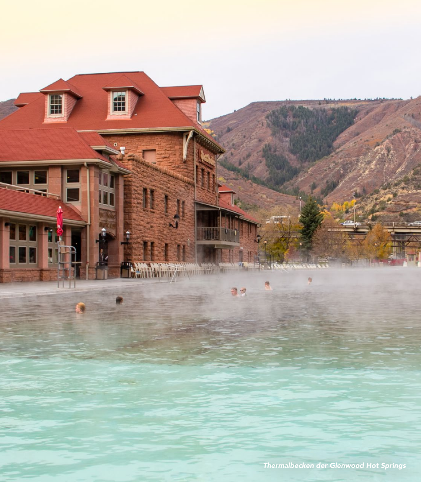
Thermalbecken der Glenwood Hot Springs