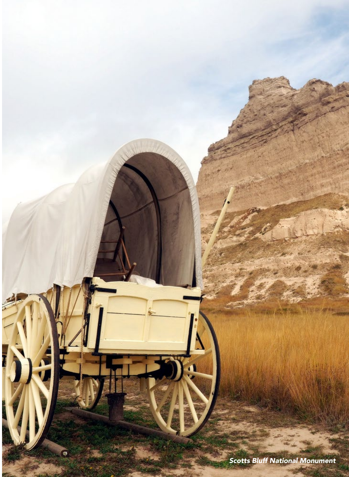
Scotts Bluff National Monument