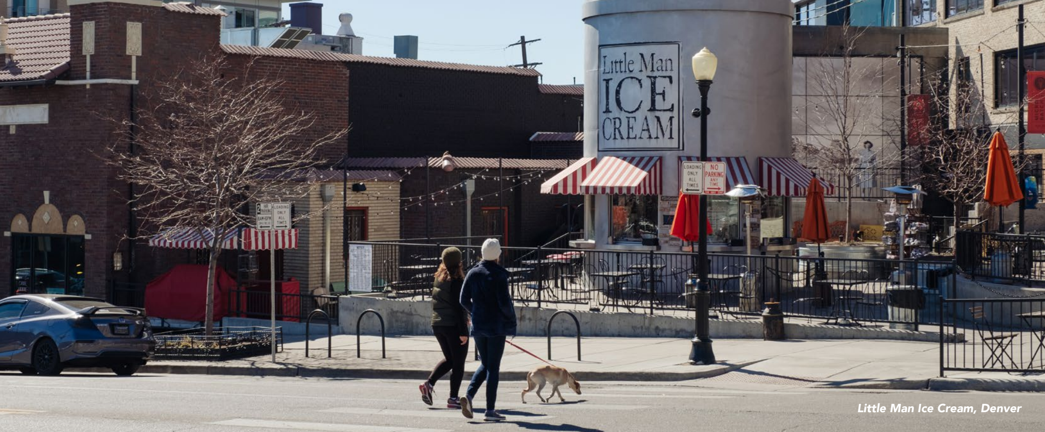
Little Man Ice Cream, Denver