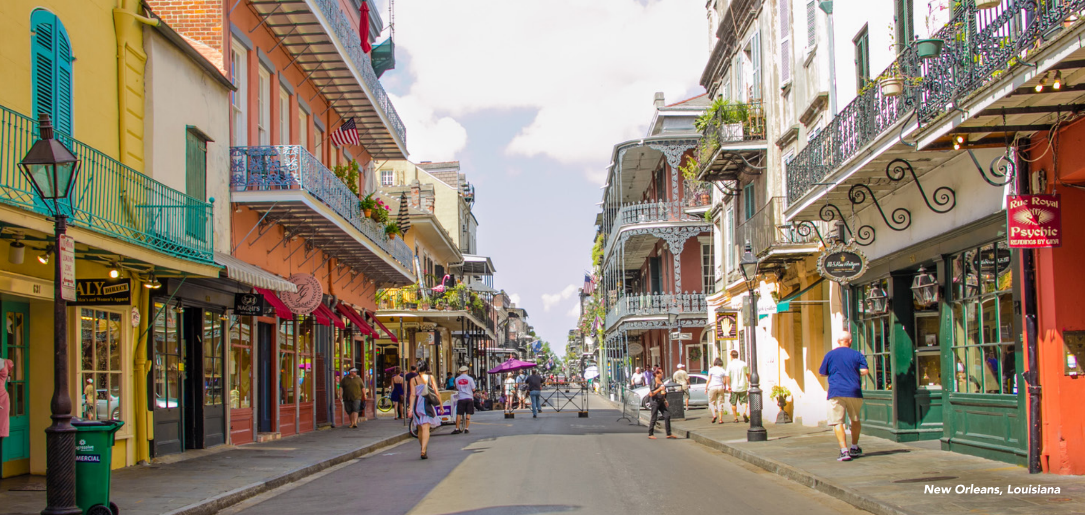
New Orleans, Louisiana