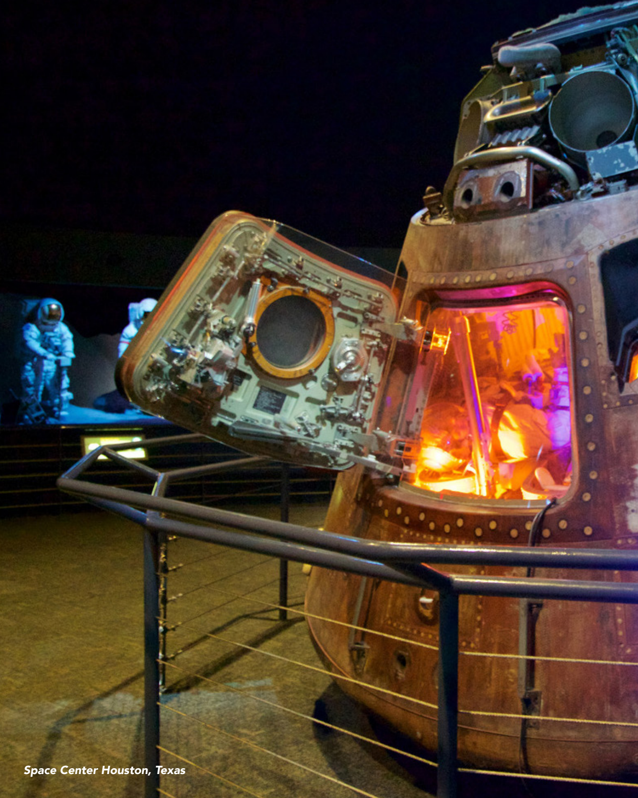
Space Center Houston, Texas