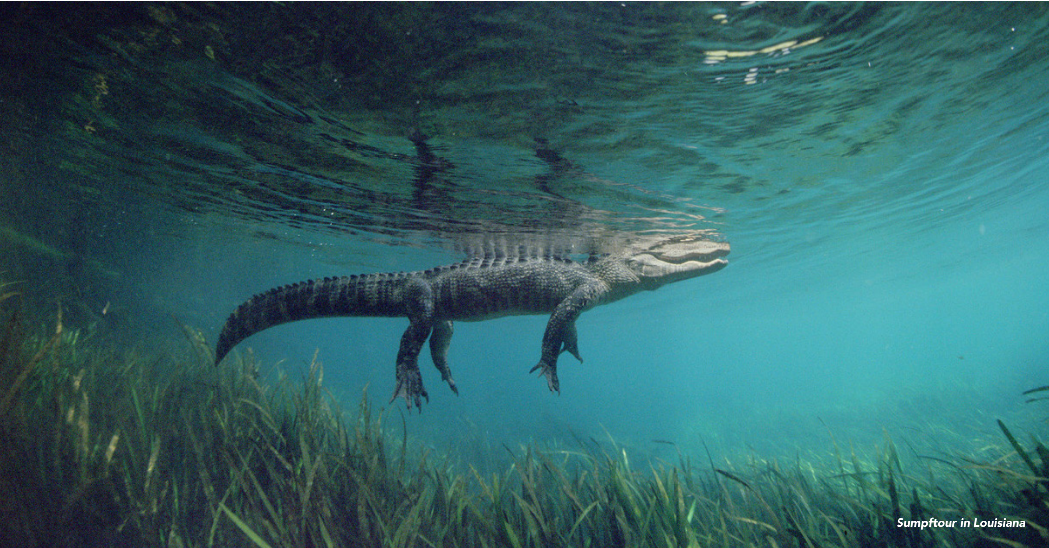
Sumpftour in Louisiana

Weitere Urlaubsinspirationen und Reisetipps für die USA erhaltet ihr unter VisitTheUSA.de .