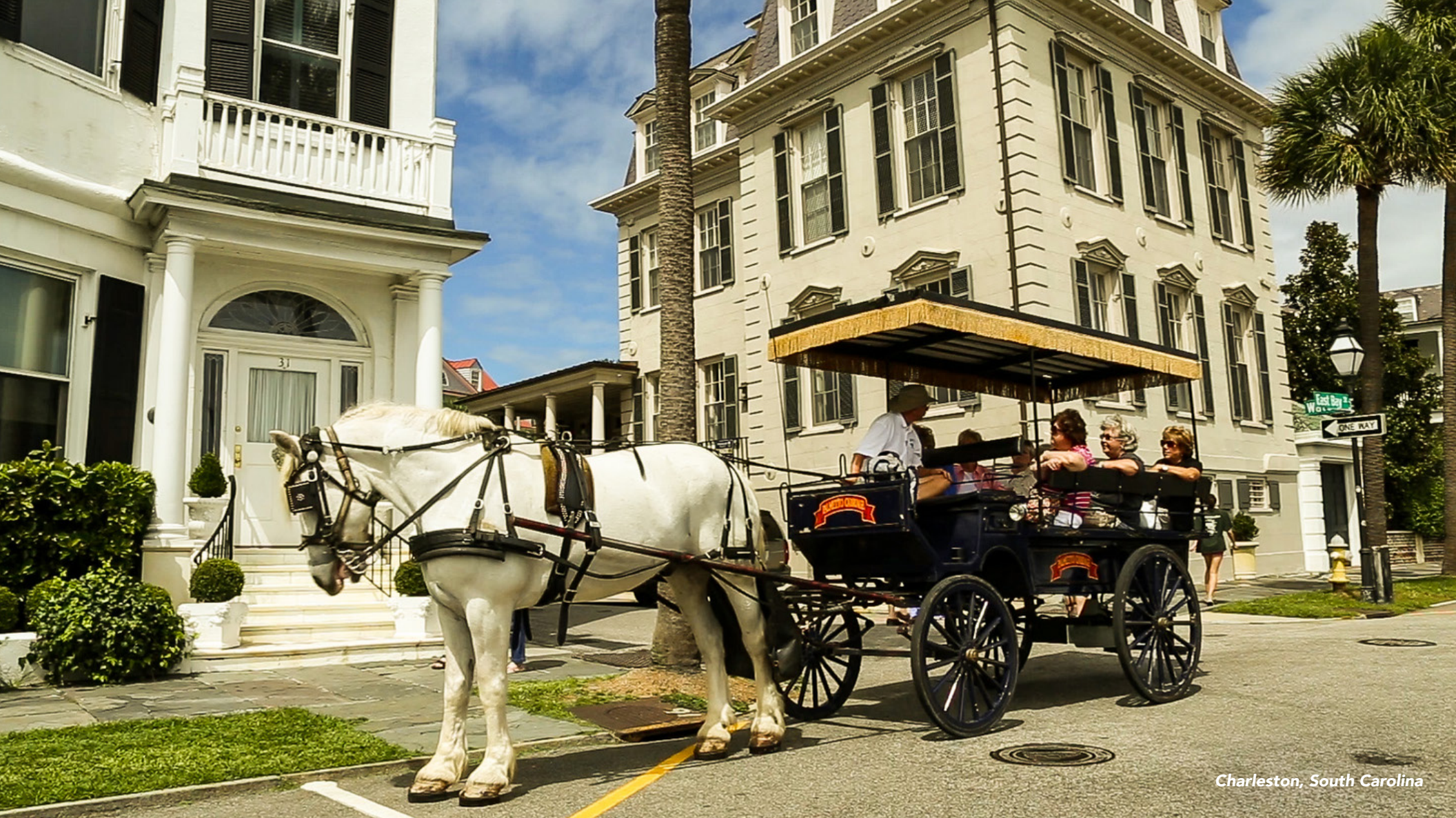
Charleston, South Carolina