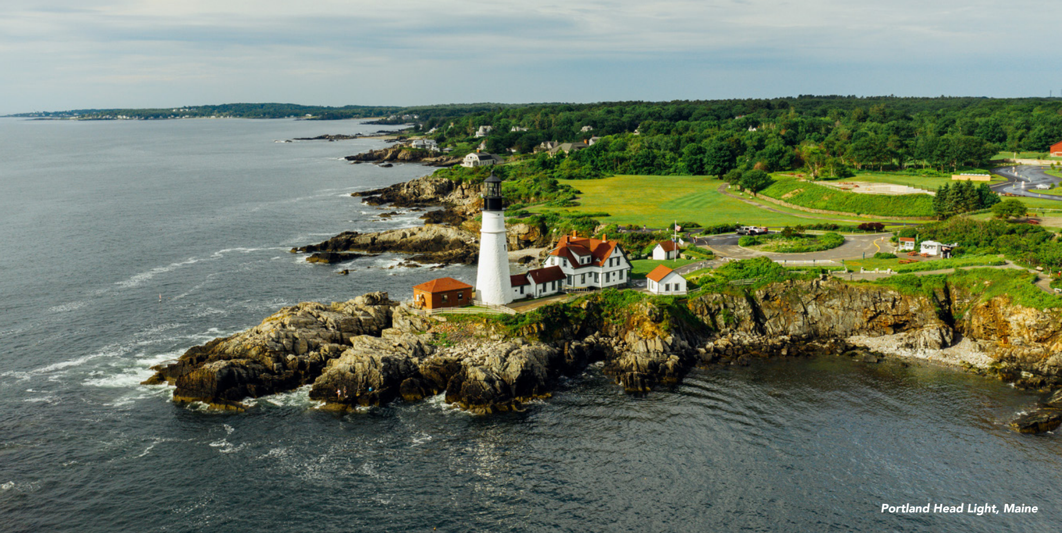
Portland Head Light, Maine