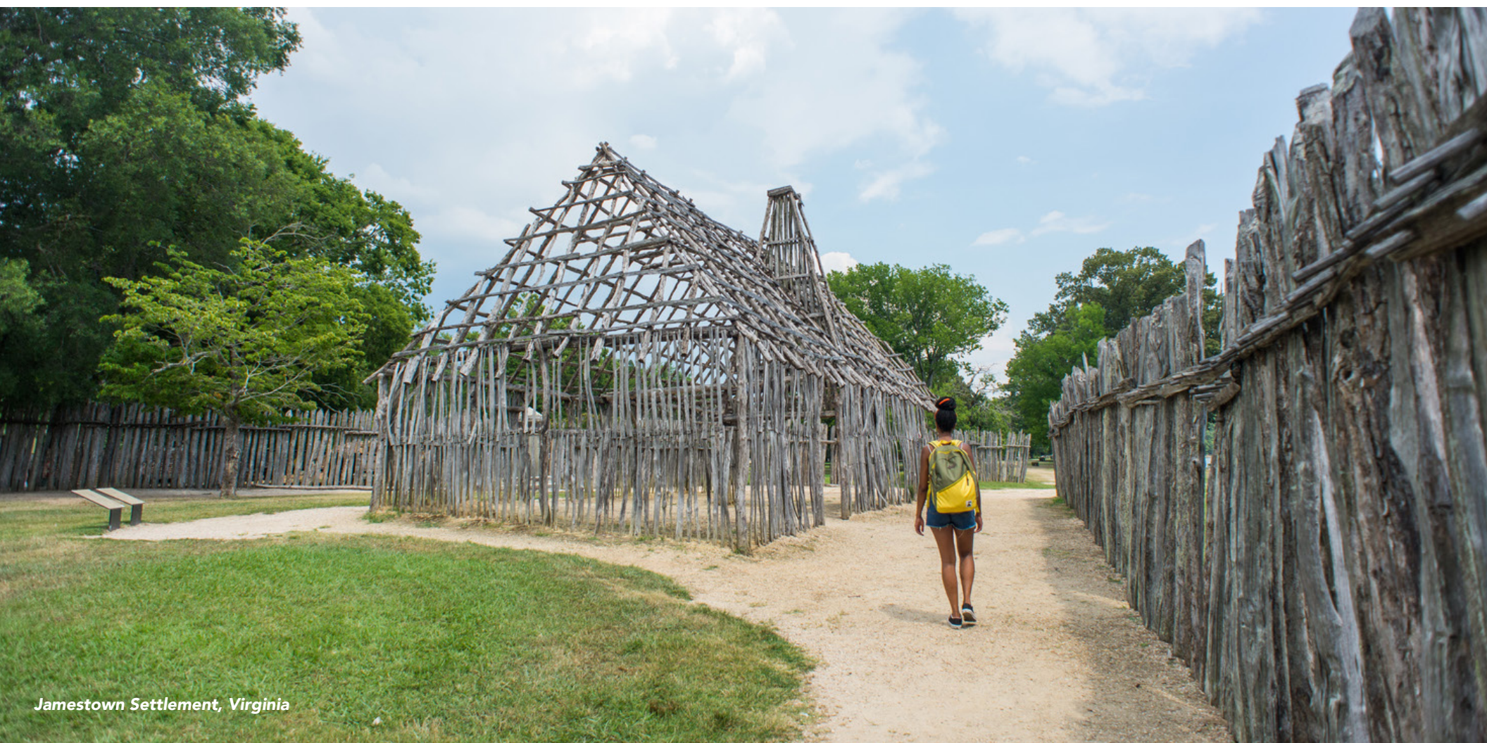
Jamestown Settlement, Virginia