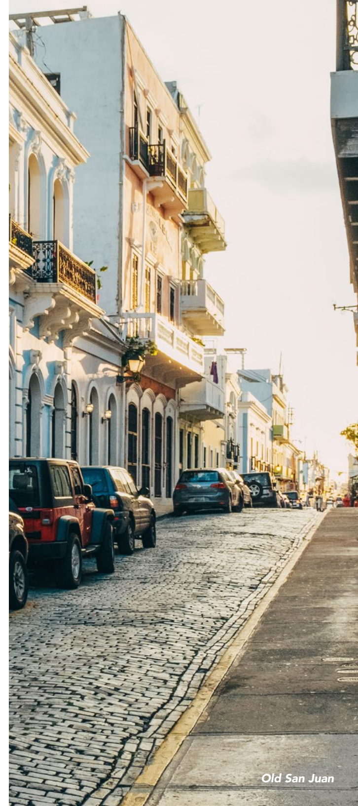
Old San Juan