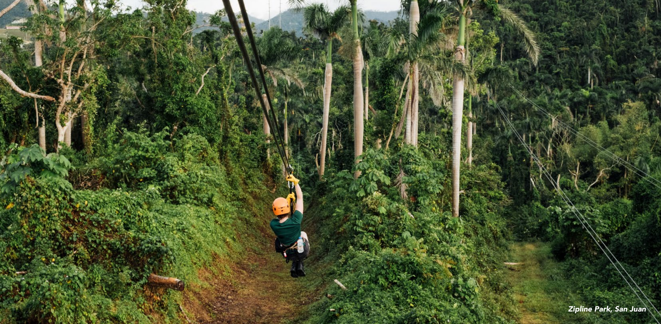
Zipline Park, San Juan