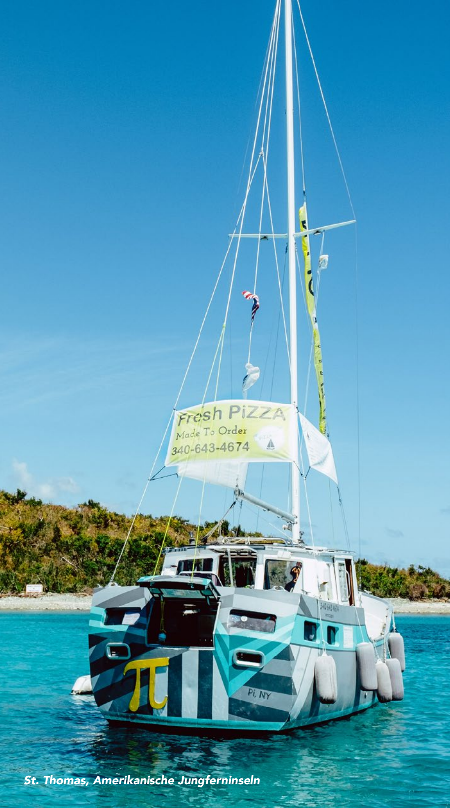
St. Thomas, Amerikanische Jungferninseln